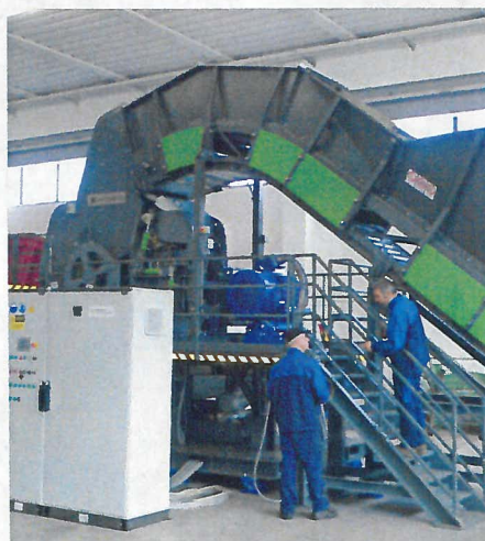
FLEX 700 Panizzolo Hammer Mill Mulino a martelli Panizzolo FLEX 700