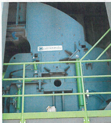
FLEX 1100 Panizzolo Hammer Mill Mulino a martelli Panizzolo FLEX 1100