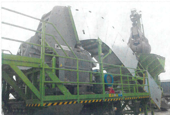
FLEX 700 Panizzolo hammer mill Mulino a martelli Panizzolo FLEX 700