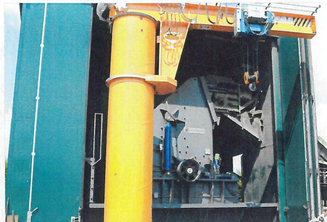
FLEX 1100 MEGA Panizzolo Hammer Mill Mulino a martelli Panizzolo FLEX 1100 MEGA